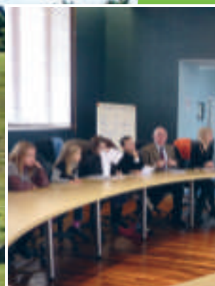
P4 Le Conseil Municipal d'Enfants