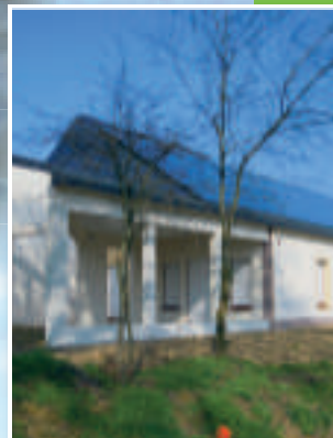
P2 Les ombelines