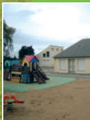
P5 Bilan des services scolaires et périscolaires