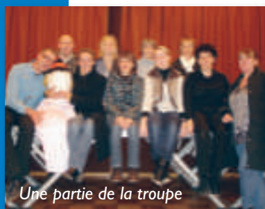
Une partie de la troupe

« Tranches de bluff » de Jean-Claude Martineau.