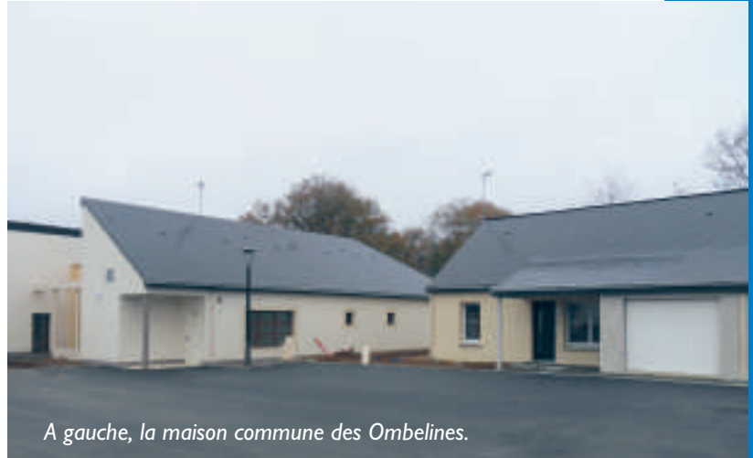
A gauche, la maison commune des Ombelines.

Ce projet, mené conjointement par la commune et la S.A « Le Logis Familial Mayennais » (CIL) est l'aboutissement d'une réflexion initiée lors du précédent mandat. Ce sont des logements à loyers modérés qui appartiennent à la société HLM. Pour en bénéficier, il